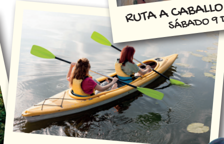
PIRAGÜISMO SÁBADO 4 DE JUNIO (18-35 AÑOS) MARTES 12 DE JULIO (14-17 AÑOS)