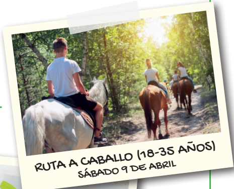
RUTA A CABALLO (18-35 AÑOS) SÁBADO 9 DE ABRIL