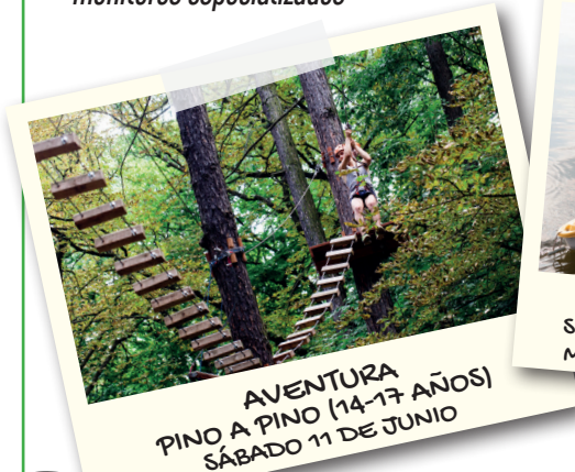
AVENTURA PINO A PINO (14-17 AÑOS) SÁBADO 11 DE JUNIO